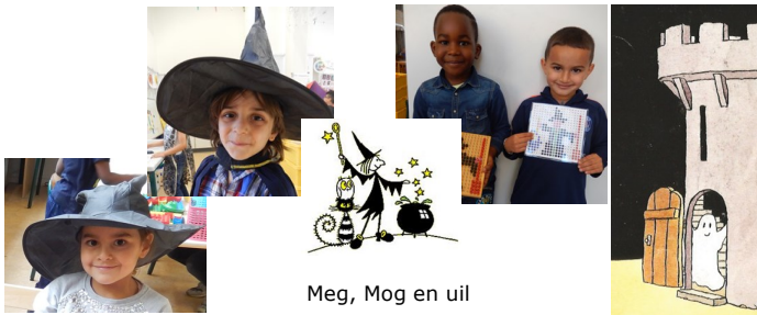
Meg, Mog en uil

Het is spannend in de groep, want veel lessen gaan over heksen. Onze heksen zijn leuke en grappige heksen. De kinderen verkleden zich als heks en bedenken toverspreuken. Het is nog spannender geworden, want de kinderen hebben kennis gemaakt met Reginald, een spookje. Hij woont in een spookkasteel. Dit kasteel wordt voor hem en zijn vriendin Oesieja gebouwd, door de kinderen.